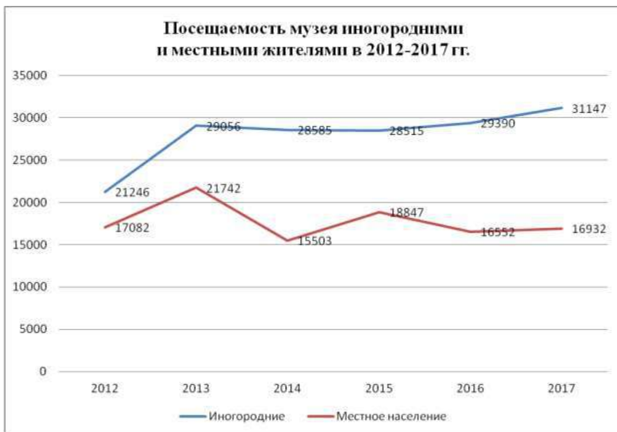
Посещаемость объектов музея в 2012-2017 гг. (тыс. чел.)